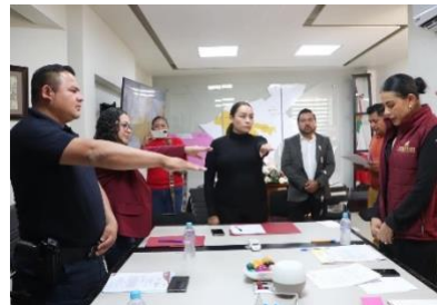
Toma de protesta del Consejo Municipal de Coordinación de Seguridad Pública