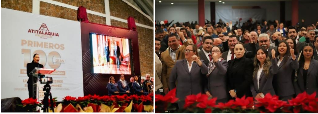
Informe de actividades de los primeros 100 días al frente de la Administración Pública