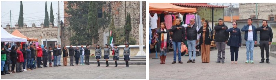
Honores a la bandera para conmemorar el 156 aniversario de la fundación del estado de Hidalgo