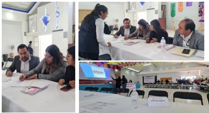
En el municipio de Tlahuelilpan, se lleva a cabo la creación de Comités de Salud, en coordinación con la Secretaría de Salud, y los Municipio de la Jurisdicción;