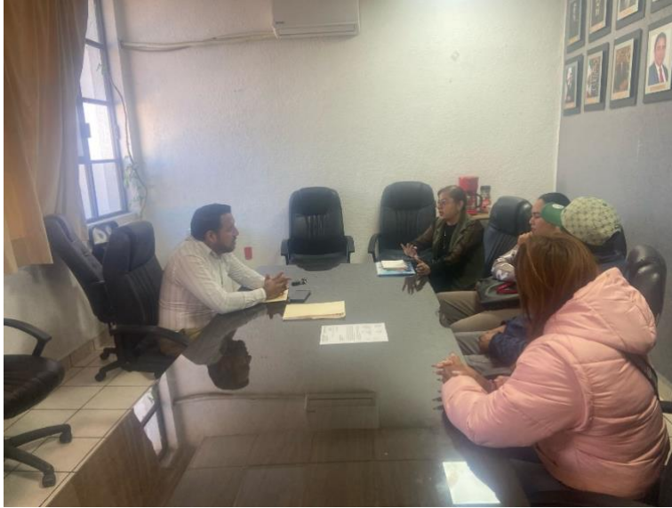
Atención al comité de padres de familia y a la directora de la escuela primaria Francisco Villa de Colonia Dendho