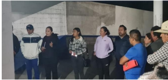
Acudimos a escuchar a los vecinos del Tablón, en cuanto a sus necesidades. Solicitaron el cambio de maya del Campo de Futbol Nápoles