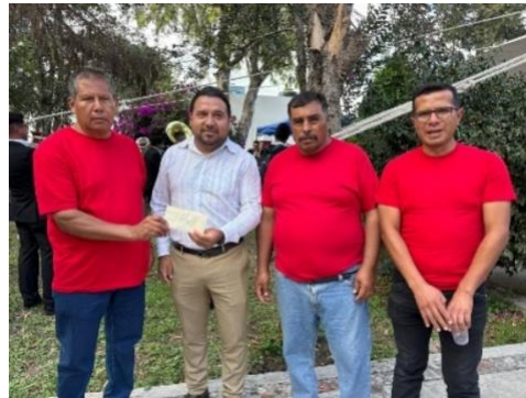
Apoyo económico al comité de feria Tlamaco 2024