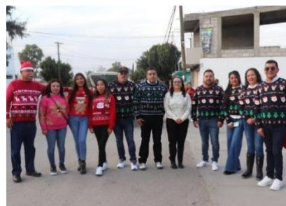
Participación en el desfile navideño