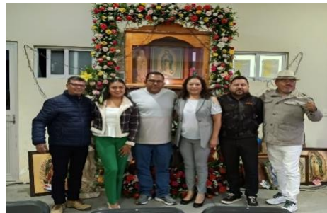
Festejo de la virgen de Guadalupe del Área de Servicios Públicos y Maquinaria, apoyamos con el adorno de la imagen.