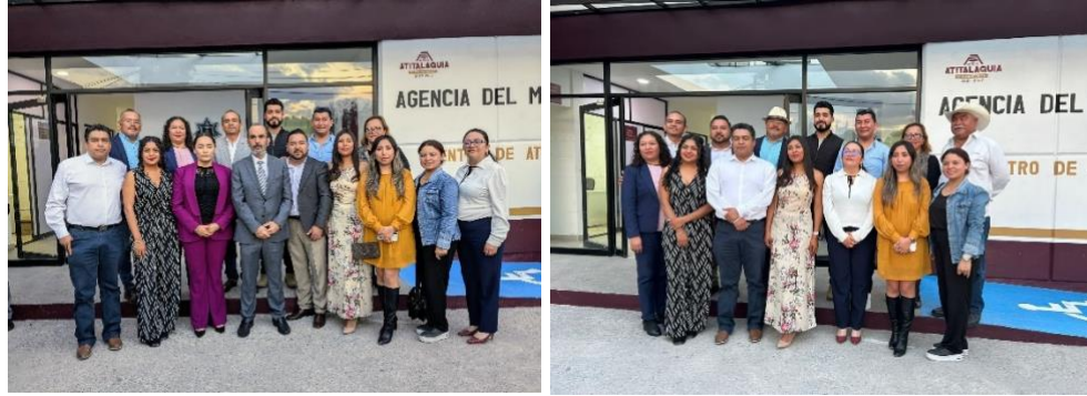
Inauguración del Centro de Atención Temprana de la Procuraduría General de Justicia del Estado de Hidalgo.