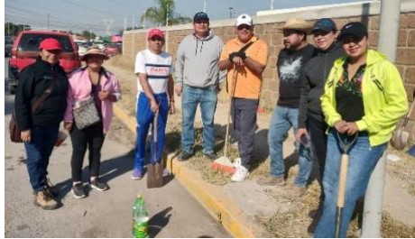
Jornada de limpieza panteón Tlamaco y comunidad de Cardonal