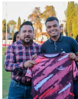
Entrega de uniformes por parte del H. Ayuntamiento al equipo representante de futbol en la categoría Sub 21 en los torneos de Semana Santa