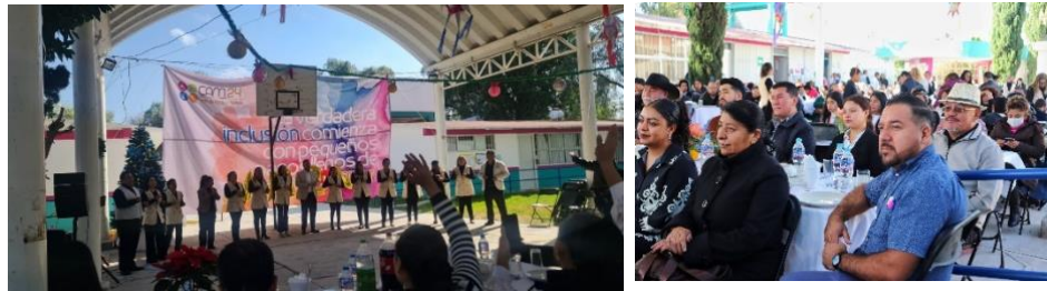
Festejo del 24 Aniversario del CAM 24