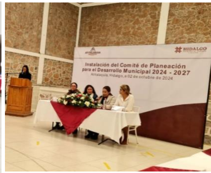
Instalación y toma de protesta del COPLADEM