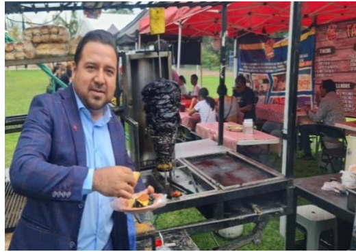
Inauguración del festival del asado y el pulque en feria Atitalaquia 2024