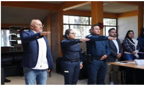
Toma de protesta del comité de Honor y Justicia