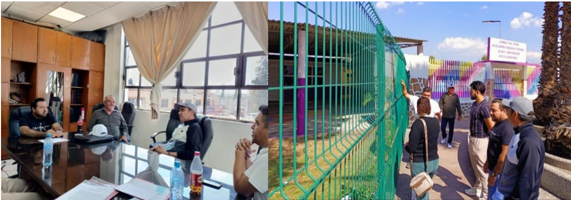
Se dictamina y se aprueba el comodato de una fracción de terreno de la plaza Fray Diego para con el Jardín de Niños Federico Froebel