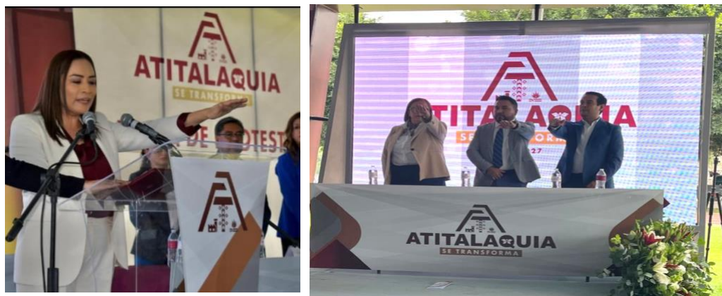
Toma de protesta de la Presidenta Municipal y el H. Ayuntamiento 2024 - 2027

ARTÍCULO 36 TER.- Quien presida la titularidad de la Presidencia entrante, rendirá la protesta de Ley ante quienes integran el Ayuntamiento saliente, acto seguido la tomará a las Sindicaturas y Regidurías.