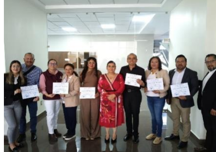
Curso guía para la elaboración del Informe Anual de Actividades