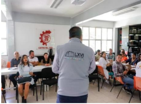
Platica sobre Facultades Reglamentarias a cargo del IDEFOM