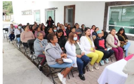
Ruta de las mujeres; la Ciudad de las mujeres ubicada en el Municipio de Tepeji del Rio, trae los servicios de, papanicolaou, colposcopias, colocación de DIU, exploración de mamas, electrocardiograma, toma de presión, toma de glucosa atención psicológica, asesoría jurídica.