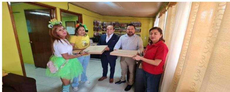
Como hace un año, donamos nuevamente todas las pizzas para festejar el día del niño en la Escuela Primaria Francisco Villa de Colonia Dendho.