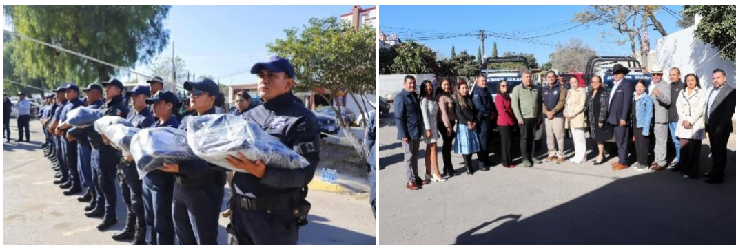
Entrega de uniformes y patrullas a elementos de Seguridad Publica