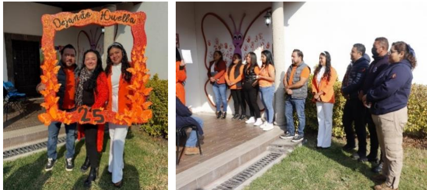
Asistimos al evento "Unidos contra la violencia a mujeres y niñas", Día naranja en Atitalaquia