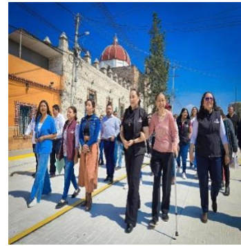
Rehabilitación de la Calle Ignacio Altamirano, Col Centro Atitalaquia