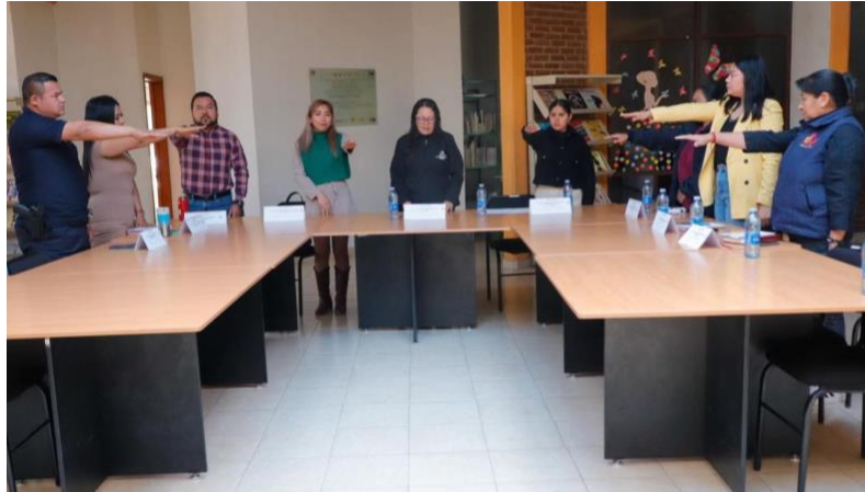
Toma de protesta del COMUPEA