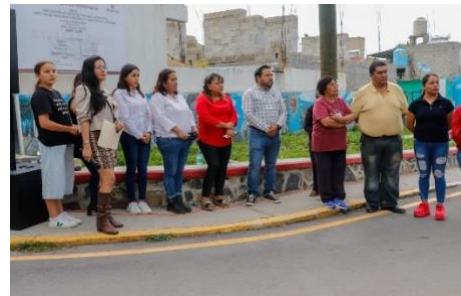
Inauguración de la Calle Av Del Deporte en Barrio Dendho