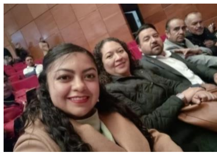
Reunión de Síndicos y Regidores, auditorio Gota de Plata, "Reunión de trabajo en temas fundamentales municipales"