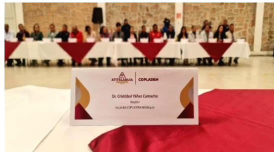
Primera Sesión Ordinaria del COPLADEM