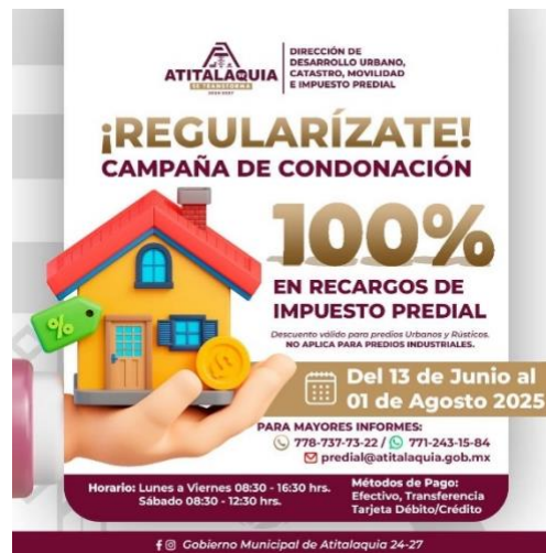
Campaña de Condonación del 100% de recargos al impuesto predial