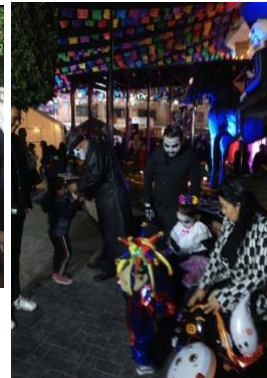
Colaboración en el adorno de la plaza cívica y jardineras en el día de muertos, participación en el desfile y en la entrega de la tradicional calaverita.