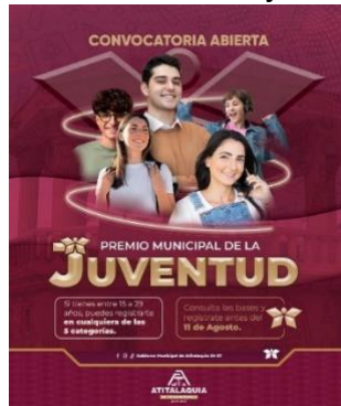
Convocatoria premio municipal a la juventud