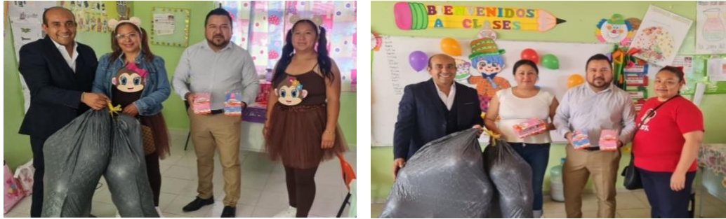
Donación de juguetes al Grupo de 4to y Sexto año de la escuela primaria Francisco Villa de la comunidad Colonia Dendho para festejar el día del niño