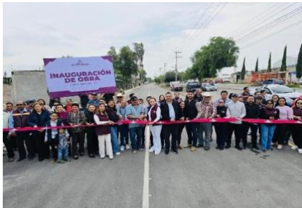
Inauguración de Calle Felipe Ángeles, Comunidad San José Bojay