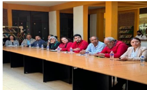
Mesa de trabajo del Consejo municipal de PC