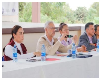
Mesa de trabajo con personal Estatal y Federal, referente al Proyecto de Economía Circular de la Región