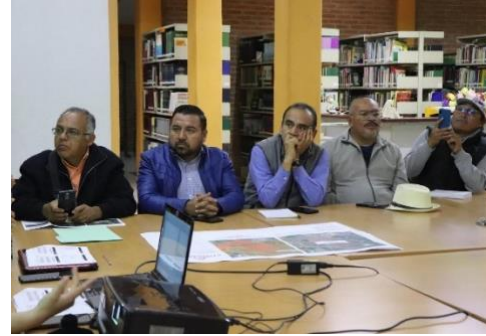
Presentación del plan de trabajo de Ecología y otros temas relevantes. Dialogo con empresas e industrias de la región