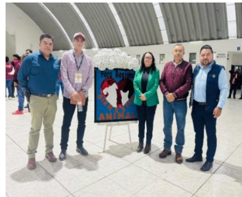
Asistencia al Foro Regional Salud – Bienestar animal para perros y gatos