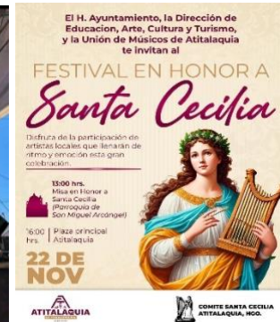
Presente en el festejo del día del músico; se otorgaron reconocimientos a los participantes.