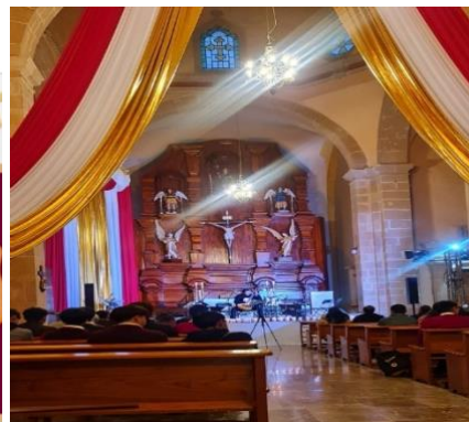
Día internacional de la guitarra, presentación, en Parroquia San Miguel Arcangel, a cargo del Ensamble Atotonilli