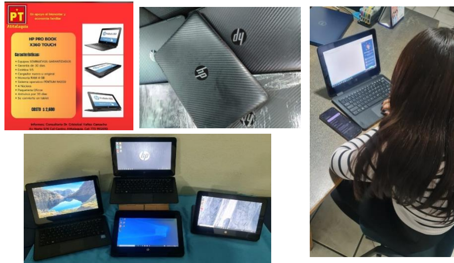
Adquisición de equipos de cómputo seminuevos garantizados a bajo costo