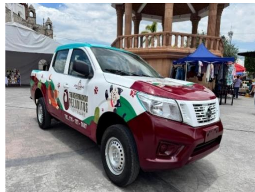
Entrega de vehículo gestionado para el Área de Salud Municipal, en específico para el Meduco Veterinario, para que pueda desempeñar sus funciones de manera rápida.