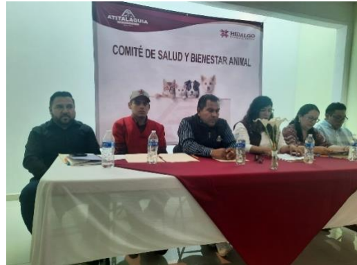
Toma de Protesta y primera mesa de trabajo del Comité de Salud