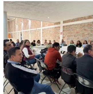
Mesa de trabajo con la comunidad LGBTT