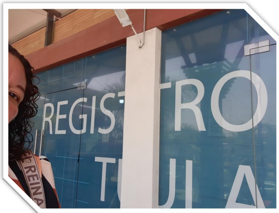
Tramite de documentos en el registro publico de la propiedad para regularización de un predio de la comunidad del Tablón.