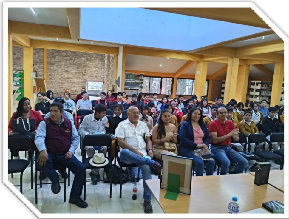
Presentación de libros en la Biblioteca Municipal