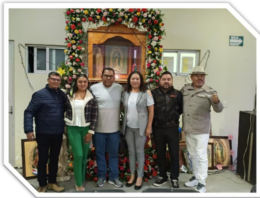
Acompañamiento en el festejo del personal de Servicios Públicos y Maquinaria