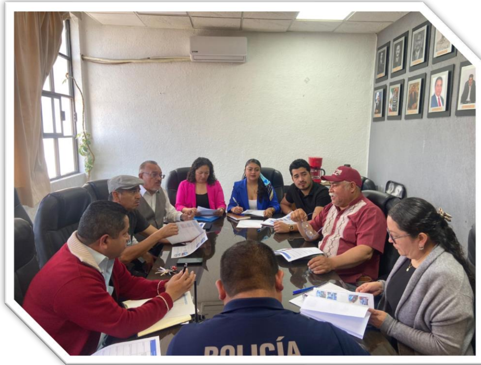
Mesa de trabajo Seguridad Pública