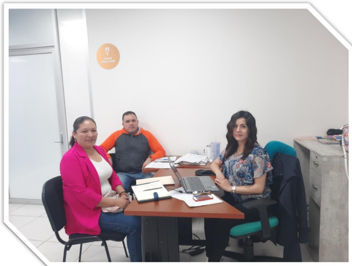
Asistencia a la Comisión de Mejora Regulatoria Estatal