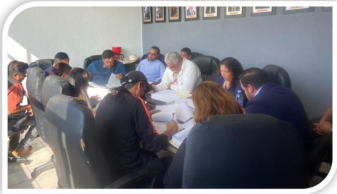
Mesa de trabajo presupuesto de egresos 2025