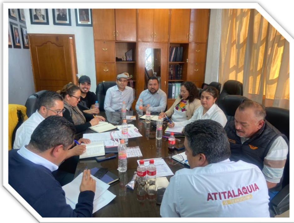
Mesa de trabajo Comisión Hacienda