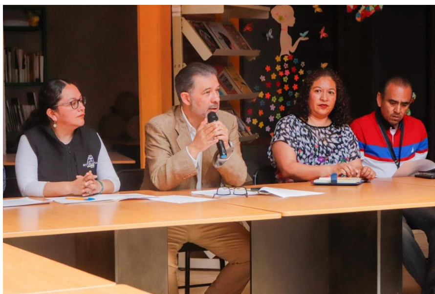
Cuarta sesión de la comisión municipal de mejora regulatoria

Así como la presentación del Anteproyecto de Reglamento para la apertura Exprés de Micro y Pequeñas empresas del municipio de Atitalaquia.