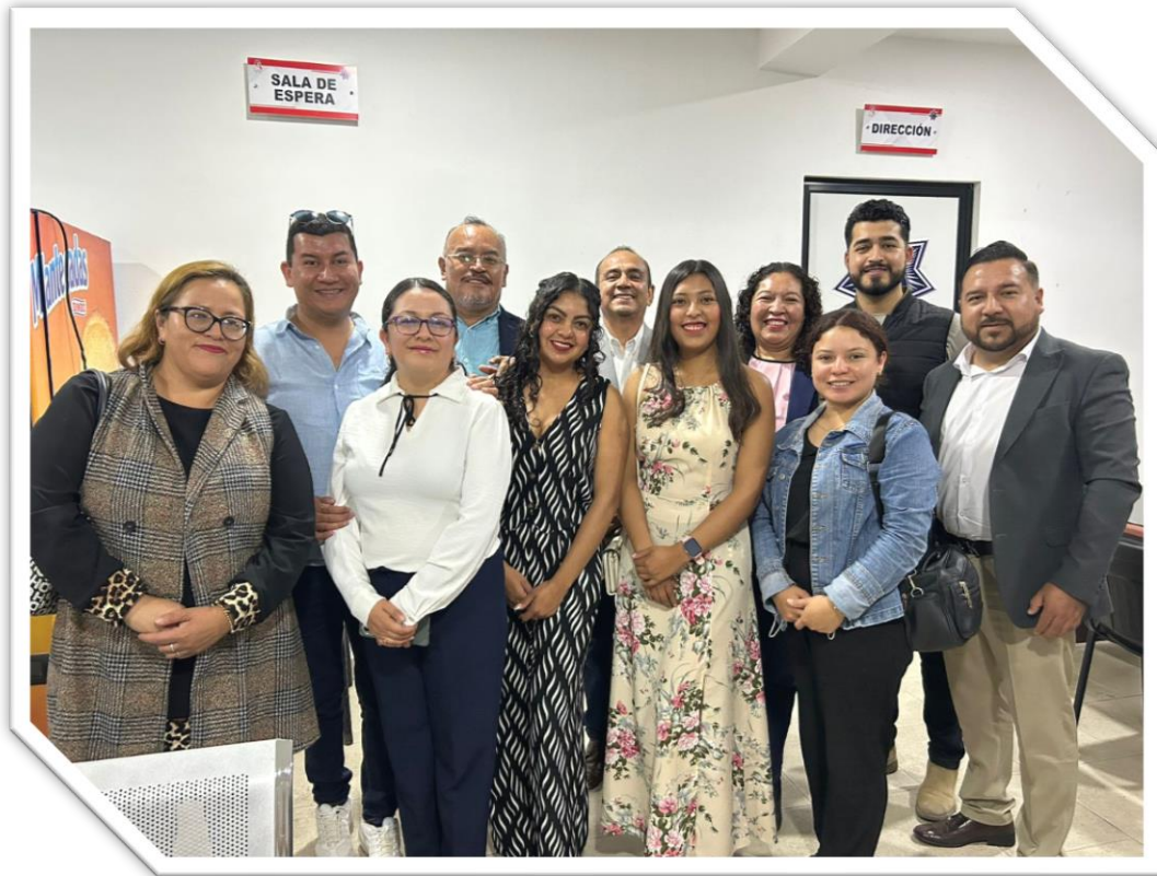
Inauguración Ministerio Público Atitalaquia