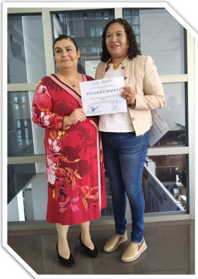
Capacitación de la elaboración del informe de actividades