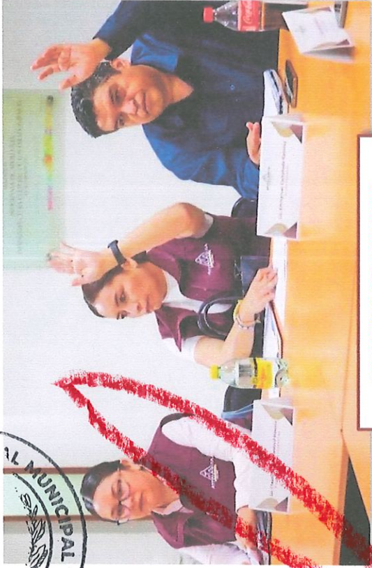
SESIONES DE CABILDO