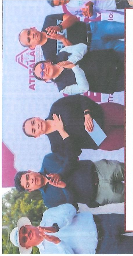
INAUGURACIÓN PAVIMENTACIÓN CDA. INSURGENTES